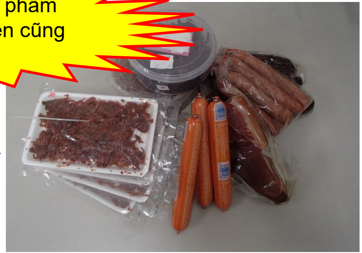
Sản phẩm cấm nhập khẩu (thịt nguội, xúc xích,...)