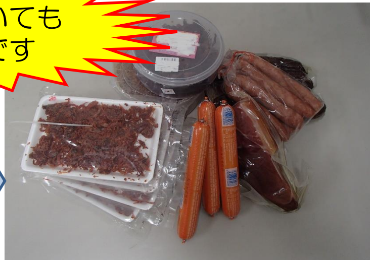
輸入禁止品（ハム、ソーセージ等）