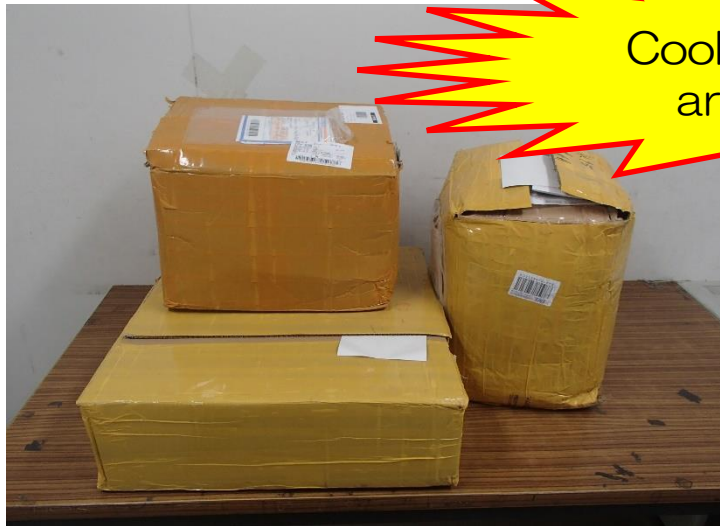
Example of packages from home

Please do not bring or put meat or egg products in your carry-on luggage, check-in luggage and packages sent from home.