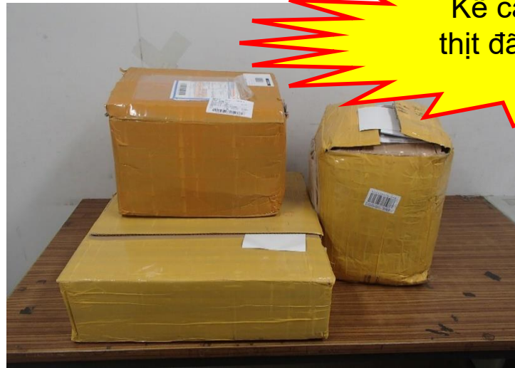
(Ví dụ) Mẫu hành lý ký gửi từ nước ngoài

Xin đừng mang theo những sản phẩm từ thịt hay trứng vào hành lý xách tay, hành lý ký gửi từ nhà bạn!