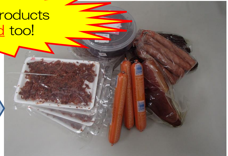
Prohibited items (ham, sausages etc)

Cooked meat products are prohibited too!